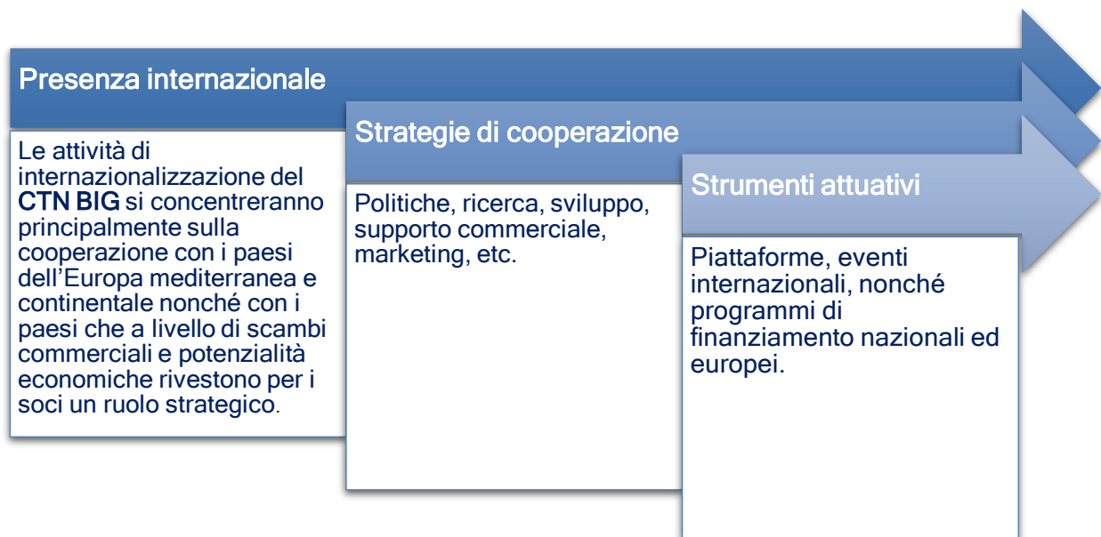
Figura 3 - Strategie di internazionalizzazione

Si possono riassumere dunque le azioni del CTN BIG in tema di internazionalizzazione in tre punti cardine: